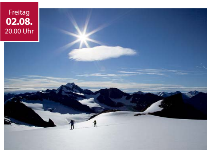
Abb. oben: Charles Brizzi, Vent im Venterthale, Ansicht gegen Norden Abb. unten: Bernd Ritschel: Taschach

Ausstellungseröffnung der neuen Fototafeln von Bernd Ritschel Fr, 02. August 2019, 17.00 Uhr bis Fr, 25. Oktober 2019 Außenbereich der Bergsteigerkapelle Vent