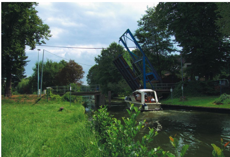
Klappbrücke in Groß Köris

Nach ca. 3 km erreichen wir eine Kleingartensiedlung. Wir müssen durch ein unverschlossenes Tor gehen, das das Eindringen von Wild verhindern soll. Kurz darauf kommen wir zur B 179. Auf ihr laufen wir nun rechts über die Brücke zwischen Klein Köriser und Hölzerner See. Links erstreckt sich der Ort Neubrück. Bereits bei der nächsten Straße biegen wir wieder rechts ab und ge-