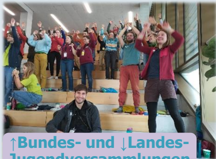
↑ Bundes- und ↓ Landes-Jugendversammlungen