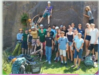
SSW Löbejün mit Alpinclubler*innen