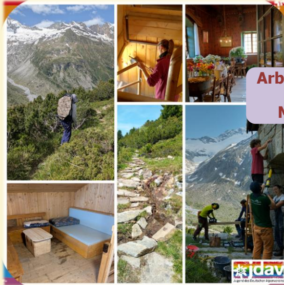
Arbeitseinsatz & JL-Fahrt Merlinhütte