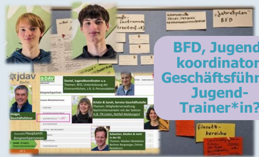
BFD, Jugendkoordinator, Geschäftsführer, Jugend-Trainer*in?