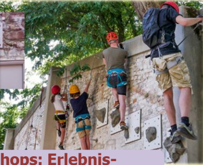
JL-Workshops: Erlebnis-pädagogik „urban“ & Klettersteig