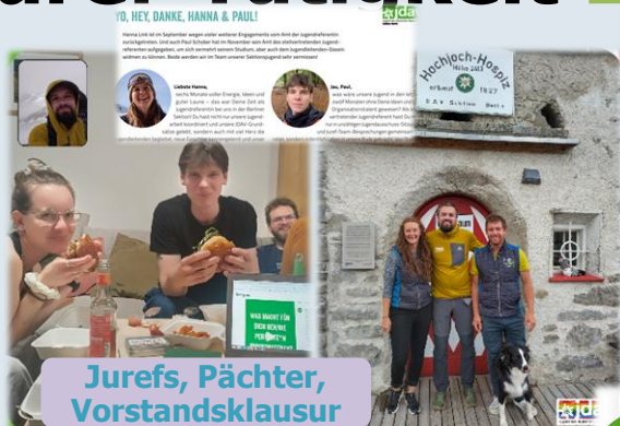
Jurefs, Pächter, Vorstandsklausur