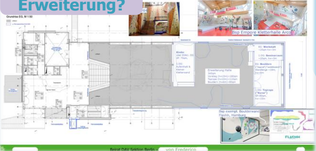
Erweiterung und zum Umbau des