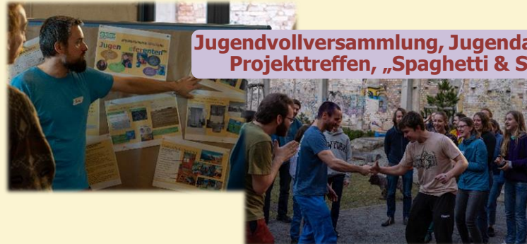
Jugendvollversammlung, Jugendausschüsse, Projekttreffen, „Spaghetti & Satzung“