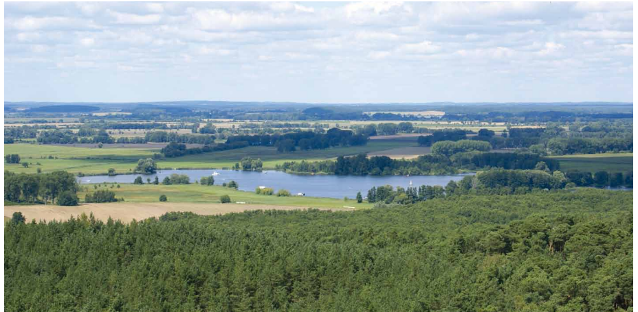
Blick zur Havel

Rechtzeitig zum 112. Deutschen Wandertag, der vom 20. bis 25. Juni 2012 im Fläming stattfand, konnte in den Götzer Bergen im Havelland ein neuer Aussichtsturm eröffnet werden. Er ist das Ziel dieser Wanderung. Vom etwas außerhalb gelegenen Bahnhof Götz laufen wir links auf der Straße in den Ort. Nachdem wir die rechterhand gelegene Kirche passiert haben, biegen wir an einem Wegweiser, der uns die Richtung zum Aussichtsturm Götzer Berge anzeigt, nach rechts ab. Der Weg ist beschildert und mit einem grünen Kreuz markiert. Nachdem wir die letzten Häuser hinter uns gelassen haben, wandern wir auf einer alten Obstbaumallee zum Fuß der Götzer Berge. Nun geht es im Wald stetig bergauf, bis wir an eine Gabelung kommen, an der wir links abbiegen und in wenigen Minuten den 42 m hohen Aussichtsturm auf dem höchsten Punkt der Götzer Berge (108,60 m) erreicht haben. Von seiner Plattform haben wir einen herrlichen Rundblick bis nach Berlin, dessen Fernsehturm man am östlichen Horizont erkennen kann. Im Westen sieht man den